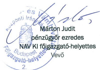
Márton Judit pénzügyőr ezredes NAV KI főigazgató-helyettes Vevő